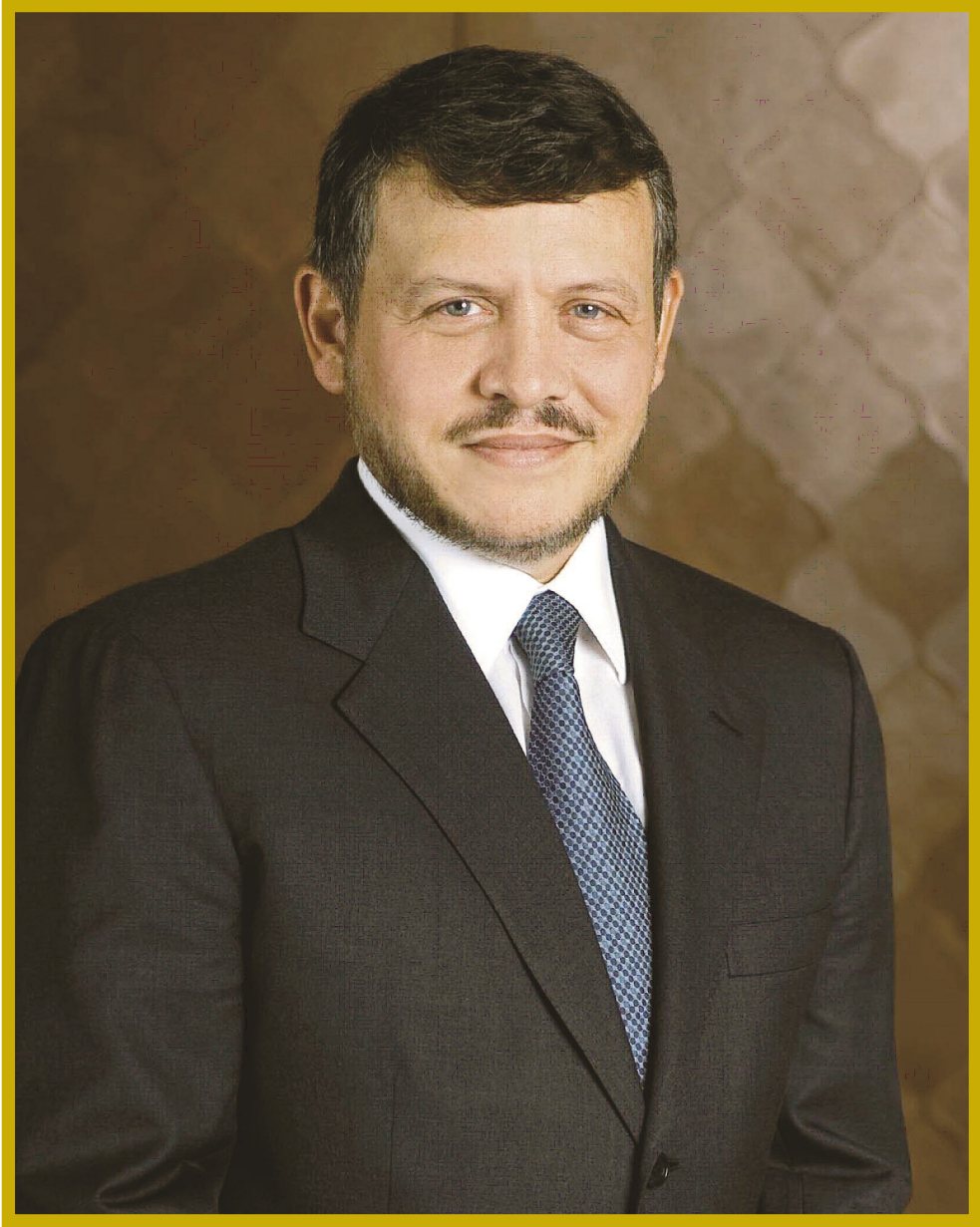
حضرة صاحب المجلة الهاشمية الملك عبد الله الثاني ابن الحسين المعظم