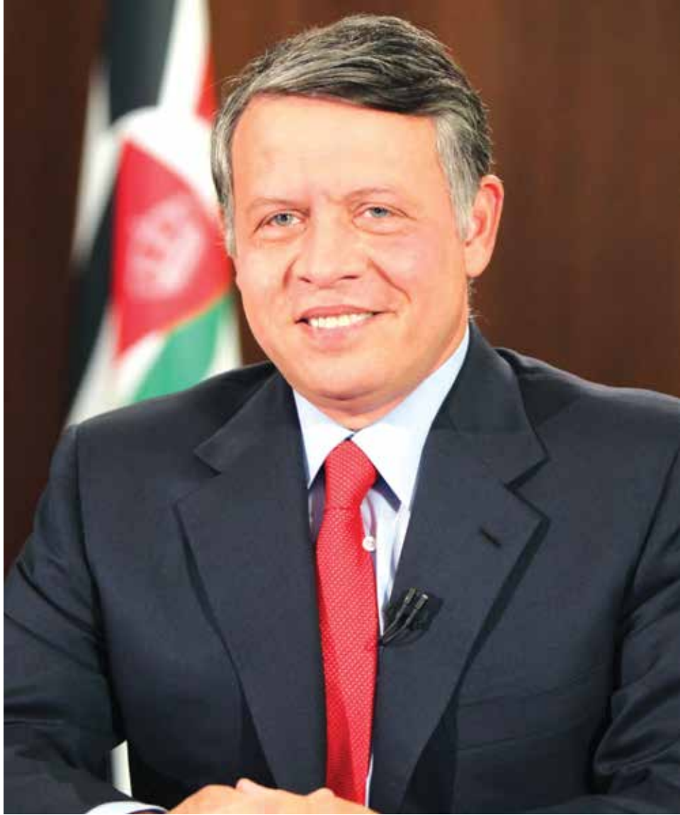
صاحب الجلالة الهاشمية الملك عبدالله الثاني ابن الحسين المعظم (حفظه الله)