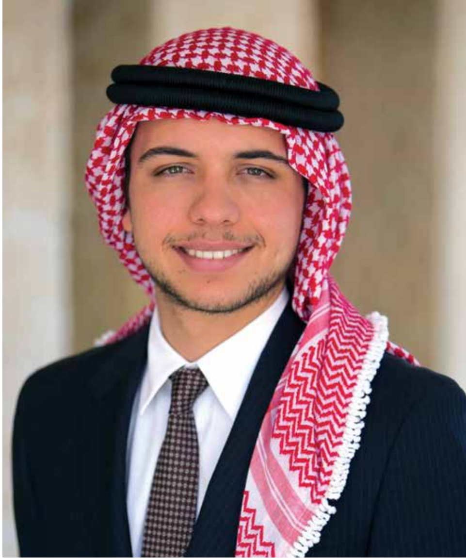
صاحب السمو الملكي الأمير الحسين بن عبدالله الثاني ولي العهد