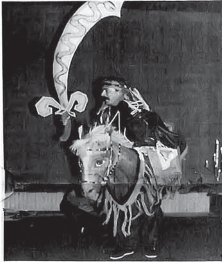
● لحظة من مسرحية الزير سالم.