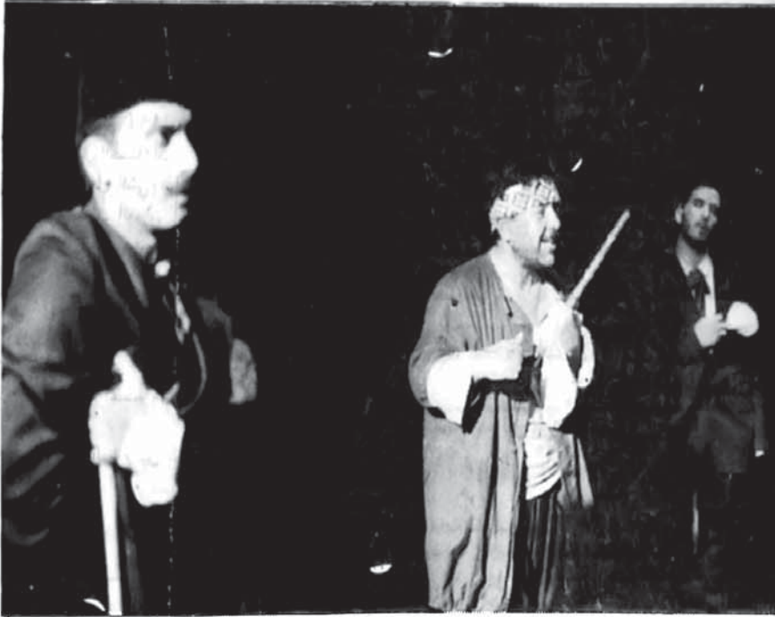
● من مسرحية (انت ومش انت) تأليف واخراج خالد الطريفي

قهننا صوت، يريد ان سمعه للناس، وهذا الصوت له عبق التاريخ، يتحدث عن عشق الناس لـ (تل الهلالي)، وكل واحد من اولئك الناس احب ذلك (التل) بطريقته الخاصة، الا ان ذلك الحب الاصيل الذي جسده شخصيتا (ثرينا) و(منير) نراه مختلفا تماما عن حب شخص اخر مثل (المشاكبي) وتابعه (زقزوق).